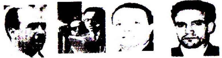
من أعضاء لجنة التنسيق والتنفيذ