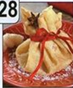
رزمة فطائر الكراب بالاجاص و الكراميل

Aumônière de crêpe aux bananes et caramel