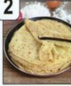
عجينة فطائر الكراب بالفانيليا