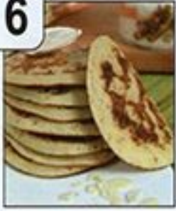
فطائر البانكاك بالياغورت