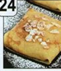
نامس فطائر الكراب بالمربي الحليب