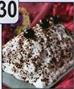
فطائر الكراب على شكل الغابة السوداء