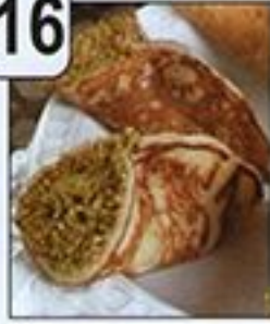
أطاييف السفيري اللبنانية