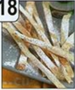
ميكادو فطائر الكراب بكريمة الشكولاتة