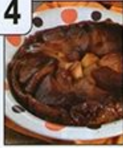
فطائر كراب تاتان