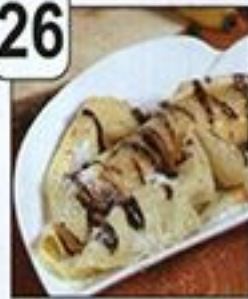
فطائر الكراب الاستوائية بالموز المكروم بالموز المكروم

Crêpes exotiques aux bananes caramélisées