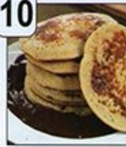
فطائر البانكاك بالقهوة و صلصة الشكولاتة