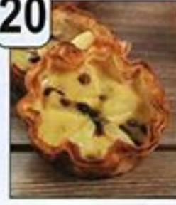
فطائر الكراب الصغيرة بالأناناس