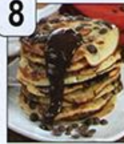
فطائر البانكاك بحبيبات الشكولاتة