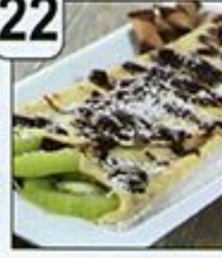
فطائر الكراب بالشكولاتة و الكيوي