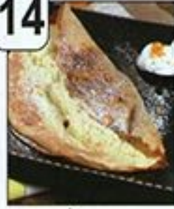
فطائر كراب سوفي بالبرتقال