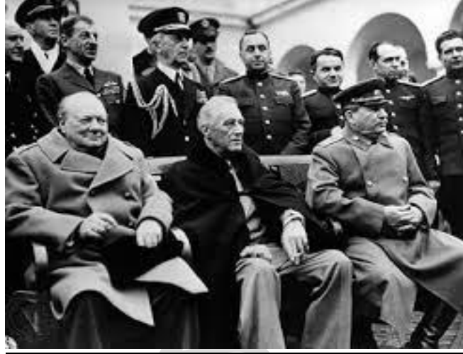
من اليمين الى اليسار: جوزيف ستالين. فرنكلين روزفلت. ونسطون تشرشل.