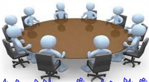
لجنة المتابعة و الإرشاد